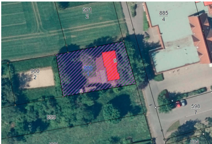
Lageplan Am alten Wasserwerk 32 (Jugendclub Mügeln)

Die Stadt Mügeln verkauft als Eigentümerin nachfolgende Grundstücke in der Gemarkung Mügeln: